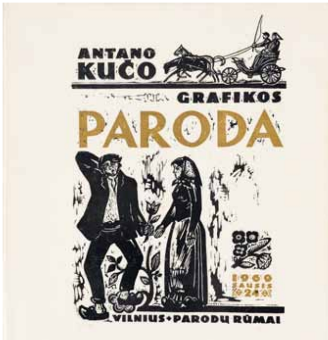
Antano Kučo 1969 m. grafikos parodos katalogo viršelis